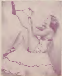
(上) 烏發女星湯瑪遜之美麗背影